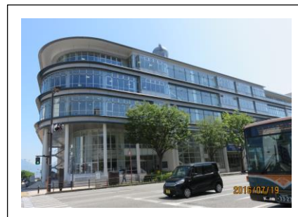
下関市立中央図書館（ドリームシップ）